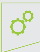
Ingénieur en production