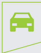
Ingénieur d'études particulièrement orientées vers les solutions innovantes dans les domaines de l'automobile, l'aéronautique et de la mécanique générale