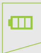
Ingénieur en conception