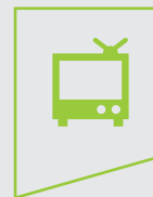
Ingénieur qualité dans les domaines de la fabrication en série de systèmes mécaniques